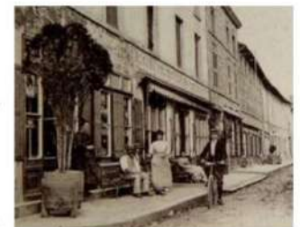
Estrablin au début du XX e siècle