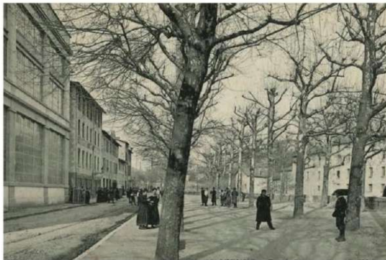
Carte postale – Collection Bibliothèque patrimoniale de Vienne en Isère – vers 1910. Sortie des usines, rue Lafayette où elles ont été installées en 1860.