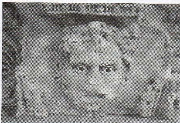
Détail de la frise du portique du forum après restauration (2007) : tête de Méduse ( ? ) ou de satyre ( ? )

Vyt (Christophe) , « L'iconoclasme huguenot à Vienne pendant la première guerre de Religion », n° 95, 2000, 4, p. 3-36