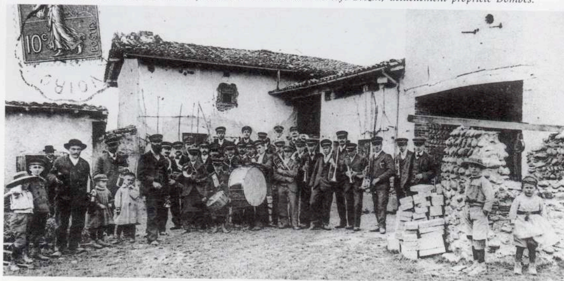
Une sortie musicale en 1910 au plan Nord où se trouvait le café Brezin, actuellement propriété Dombes.

Ce souvenir authentique nous a été conté par notre sœur née en 1903. Vers 1815, un soldat autrichien, qui sans doute voulait désertier, s'était construit une maison de fortune dans les bois de Flues près du domaine de l'Aye. Dans ses ruines, encore visibles vers 1920, avait été retrouvé un carnet de notes de musique au nom de Wagner... Malheureusement, ce précieux document a été brûlé... avec bien d'autres.