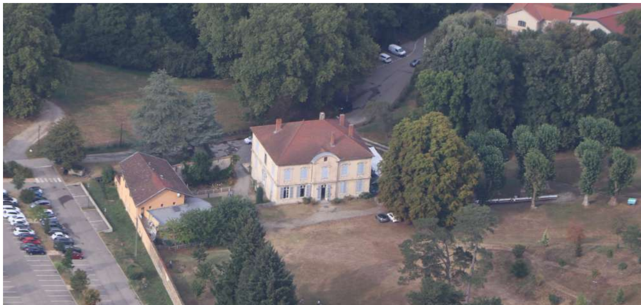
Vue aérienne du château de Gemens en 2023

En tout cas, Gemens était un lieu de retraite pour les jeunes préparant leur 1 ère ou 2 ème communion.