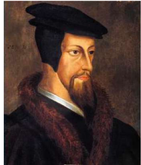
A droite, portrait Jacques Calvin